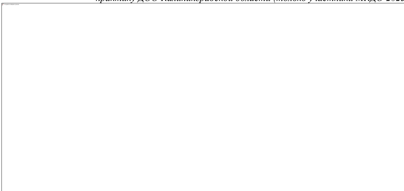
Таблица 2. Результаты мониторинга эффективности внедрения ФОП ДО в рамках МКДО 2023