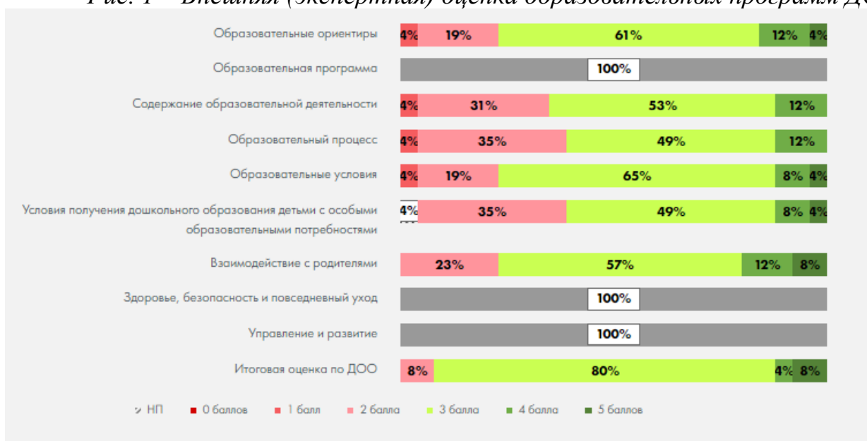
Рис. 1 – Внешняя (экспертная) оценка образовательных программ ДОО

По результатам представленным на рис. 1, менее 40% ДОО-участников Мониторинга получили экспертную оценку ниже базового уровня (0-2 балла) по показателям: