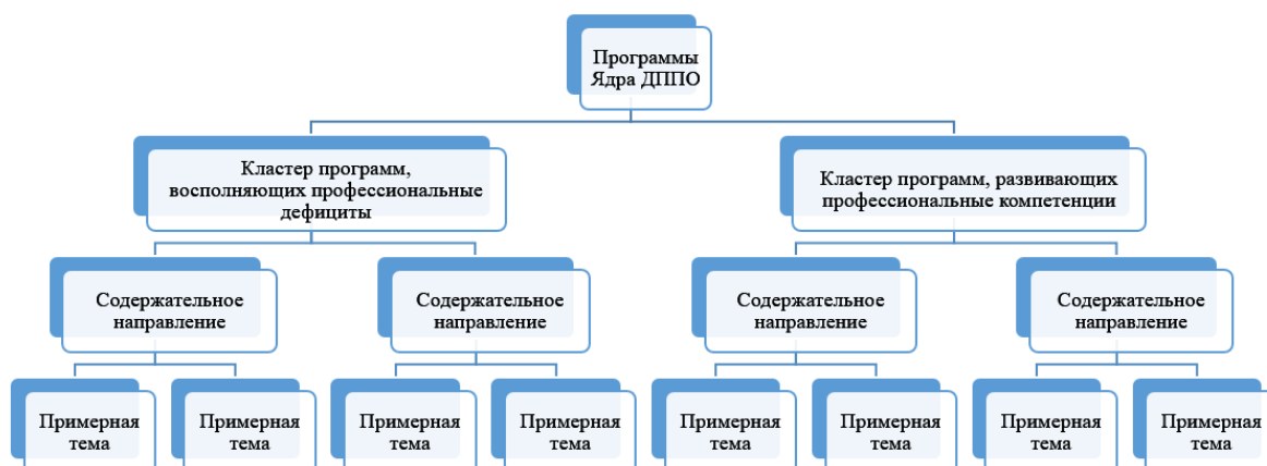
Рис. 1а. Иерархическая модель классификации программ Ядра ДПО