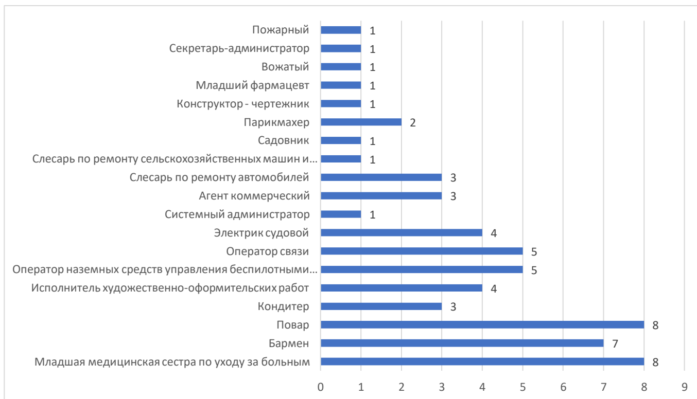
Диаграмма 1. Количество общеобразовательных организаций, обучающиеся 10-х классов которых подали заявки на обучение по профессиям в 2022/2023 учебном году

В 2022/2023 учебном году в рамках проекта приняли участие восемь профессиональных образовательных организаций Калининградской области, которые стали сетевыми партнерами для 22 общеобразовательных организаций.