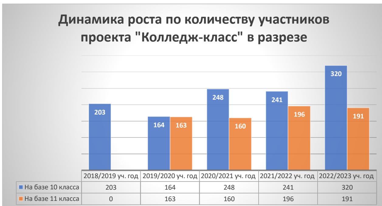
Диаграмма 2. Динамика роста по количеству участников проекта «Колледж-класс» в разрезе за период 2018-2023 календарного года

Согласно результатам проекта «Колледж-класс» за 2022-2023 учебный год, только 6 человек поступили в партнерские профессиональные образовательные организации, 88 выпускников поступили в профессиональные образовательные организации Калининградской области, 67 выпускников поступили в высшие учебные заведения Калининградской области и 25 выпускников поступили в учебные заведения в других регионах ( см. Диаграмма 3).