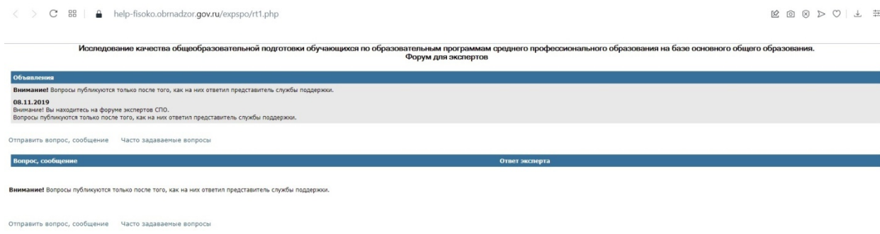
Рис. 2. Форум для экспертов

можно отправлять также на адрес электронной почты технической поддержки helpfisoko@fioco.ru