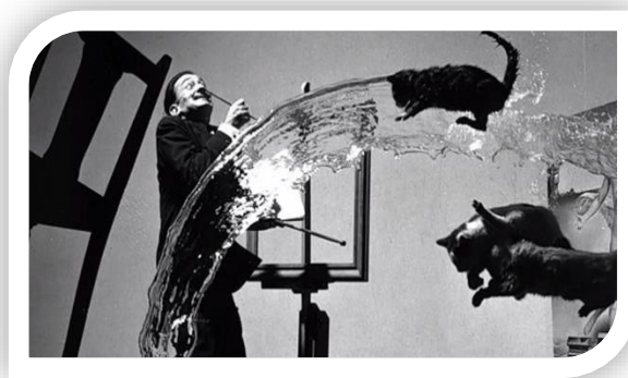
«Парящие коты» Идея Сальвадор Дали

По мнению Сальвадора Дали, настоящее лицо человека можно увидеть тогда, когда он увлечен каким-то процессом и совершенно не задумывается, как выглядит. Например, когда человек парит в воздухе, в прямом смысле, высоко подпрыгивает- и маска спадает.