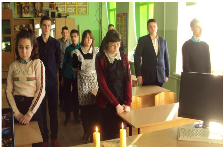
«125 гр. блокадного хлеба» -Устный журнал в 9 кл.