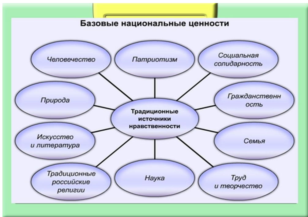
Рисунок 1. Базовые национальные ценности