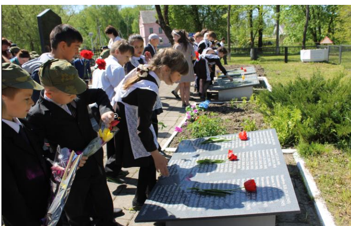
Возложение цветов к памятнику погибших воинов на митинге ко Дню Победы