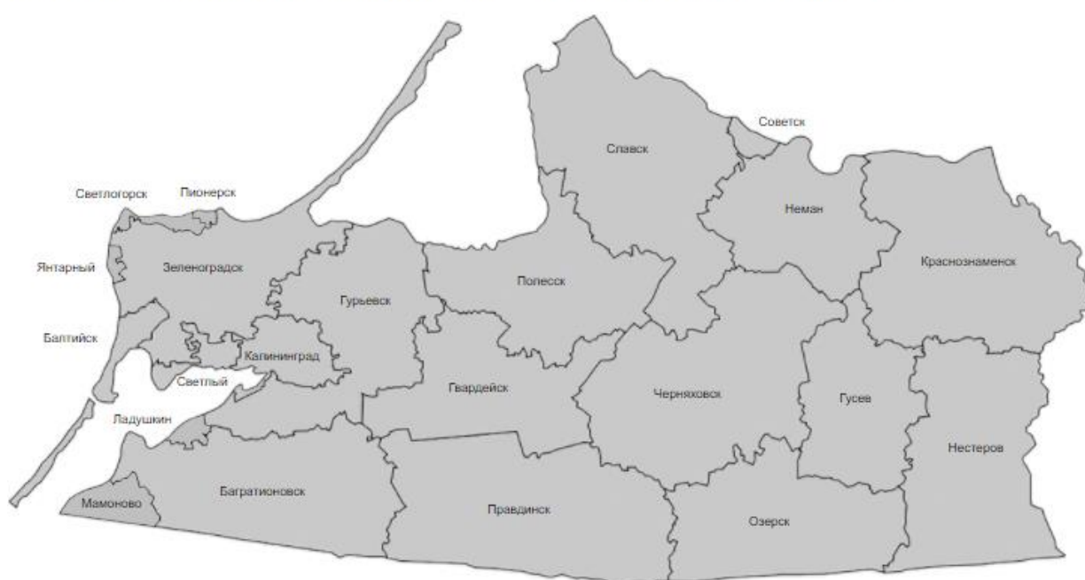
Рис. 1. Интерактивная карта «ЦОС в Калининградской области»

🏠 Главная > Центр информатизации образования > Цифровая образовательная среда > Карта