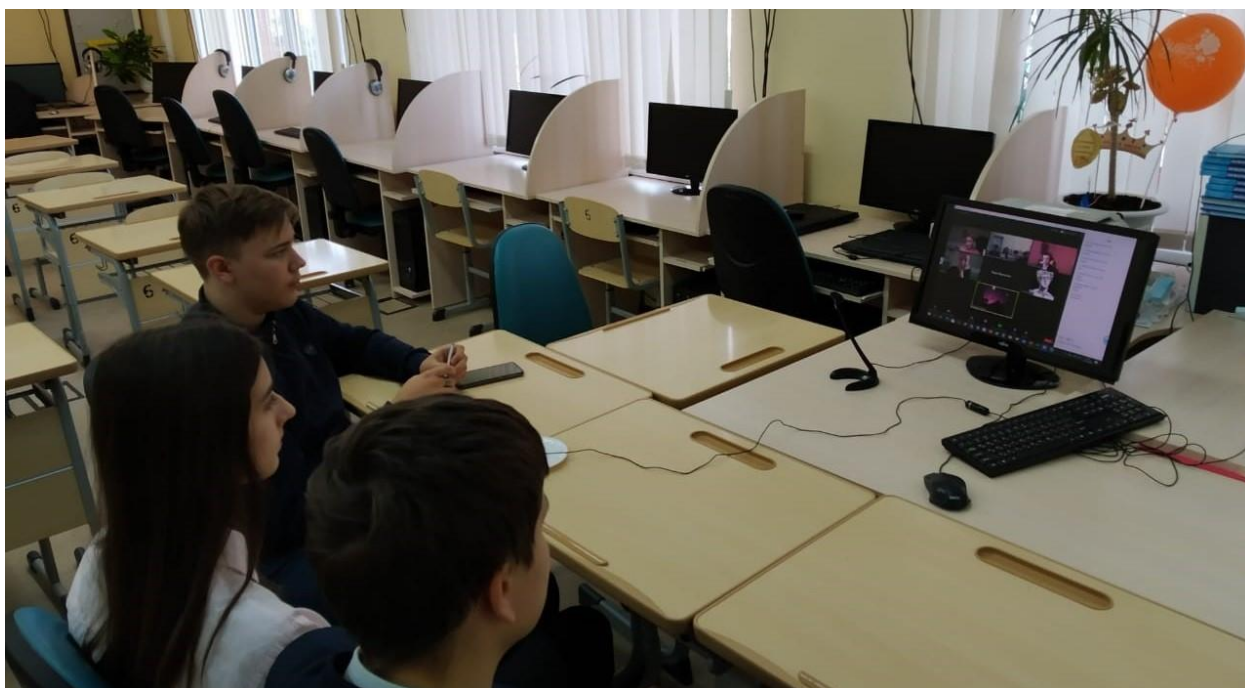
Рис. 2. Учащиеся лицея № 10 г. Советска участвуют 27.10.2020 в онлайн конференции с разработчиками ИКОС

С целью проведения тестирования сервиса цифровой образовательной среды - информационной системы «Информационно-коммуникационная среда» ( https://edu.vk.com/ ) и изучение моделей поведения пользователей системы, в 3 образовательных организациях региона (МБОУ гимназия № 7 г. Балтийска имени Константина Викторовича Покровского, МАОУ «Лицей №10» г. Советска, МАОУ «Гимназия №2 г. Черняховска») апробируются возможности системы для информационно-коммуникационного взаимодействия с участниками образовательного процесса, создания школьных сообществ, ведения чатов школ, классов, для удаленного проведения занятий и совещаний до 100 человек.