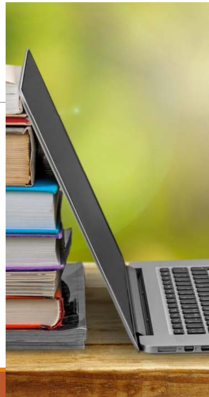
график «онлайн-дежурного» педагога по горячей линии

работы дежурной группы (если она имеется)