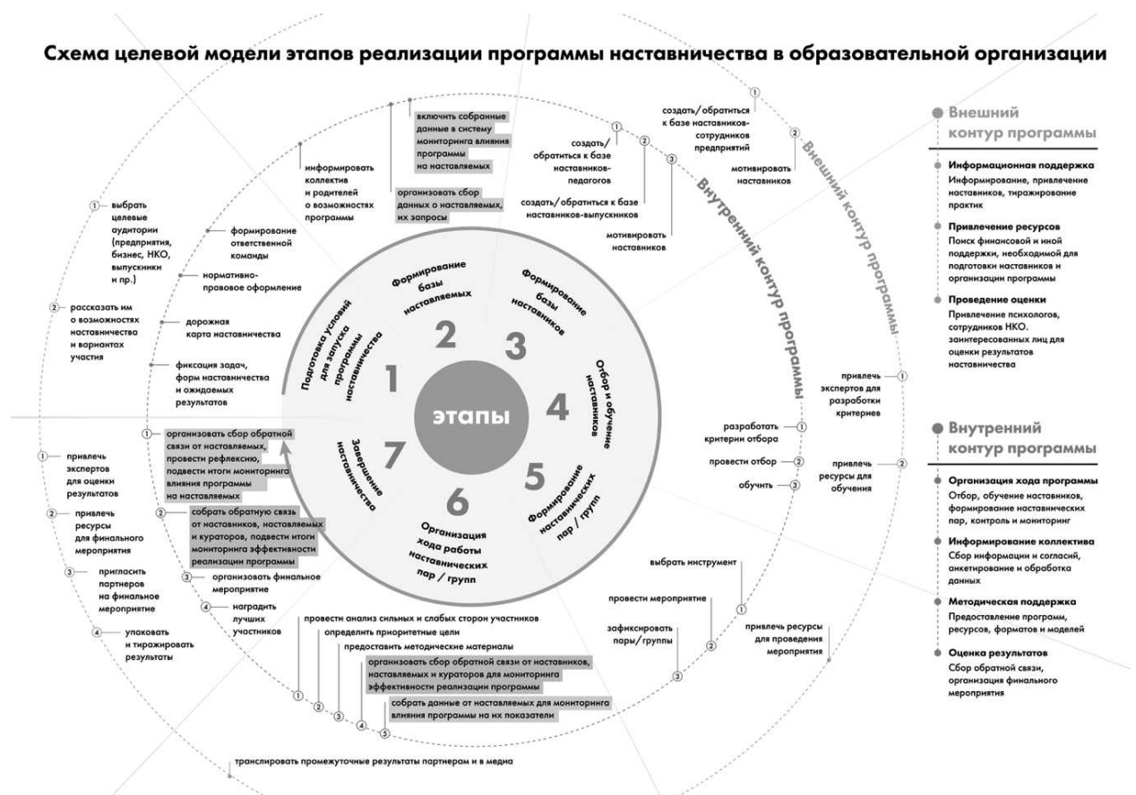
Рис. 1. Схема целевой модели этапов реализации программы в образовательной организации

Содержание каждого этапа, представленное в виде направлений работы с внутренним и внешним контурами, содержится в таблице 1 «Целевая модель этапов реализации программы наставничества в образовательной организации».