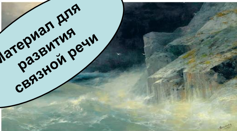
И. Айвазовский. Шторм