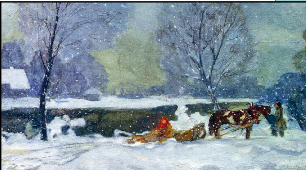
Г. Бобровский. Зима. Снег идёт

Древние греки приветствовали друг друга так: «Радуйся!», а современные греки: «Будь здоровым!» Арабы говорят: «Мир с тобою!», индейцы: «Всё хорошо!» (С. Львова)