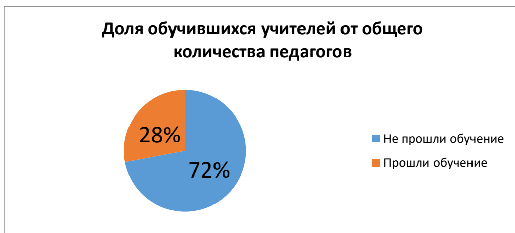
Рис 2. Доля обучившихся учителей от общего количества педагогов. 1957 учителей прошли обучение на семинарах в период с ноября 2018 по декабрь 2019 года, что составляет 28% от общего количества педагогов.

Данный проект позволил педагогам по-новому взглянуть на преподавание в XXI веке, помог раскрыть новые возможности обучения современных школьников и создал условия для перехода от пассивных к замотивированным ученикам XXI века.